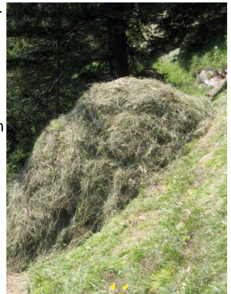
Wildheu im Steilhang versperrt den Weg

jedoch länger haben, um uns in Ruhe Flora, Fauna und dem Thema Wildheuen widmen zu können.