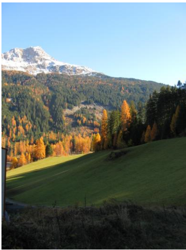
Auf dem Piz La Tschera liegt schon Schnee

Auf einer Wanderung im Val Schons (Schams) wollen wir uns ein wenig den für uns so eigenartig anmutenden Schalen- und Zeichensteinen annähern. Schon viel wurde über diese Spuren der Megalithkultur, im Volksmund auch Hexenzeichen, Opfersteine oder Heidenplätze genannt, gerätselt und geforscht, wir wollen davon einen kleinen Eindruck bekommen. Staunend ahnen wir die komplexen Gesetzmässigkeiten und die Vernetzung in der Landschaft, auch mit heute christlichen Stätten.