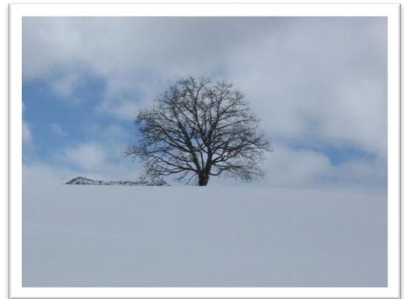
Immer wieder begegnen uns jahrhundertealte, mächtige Bergahorn- Bäume

Ab von etwa 100 Höhenmetern, wobei wir bis zur Schwägalp Passhöhe zwischendurch immer wieder ein wenig aufsteigen.